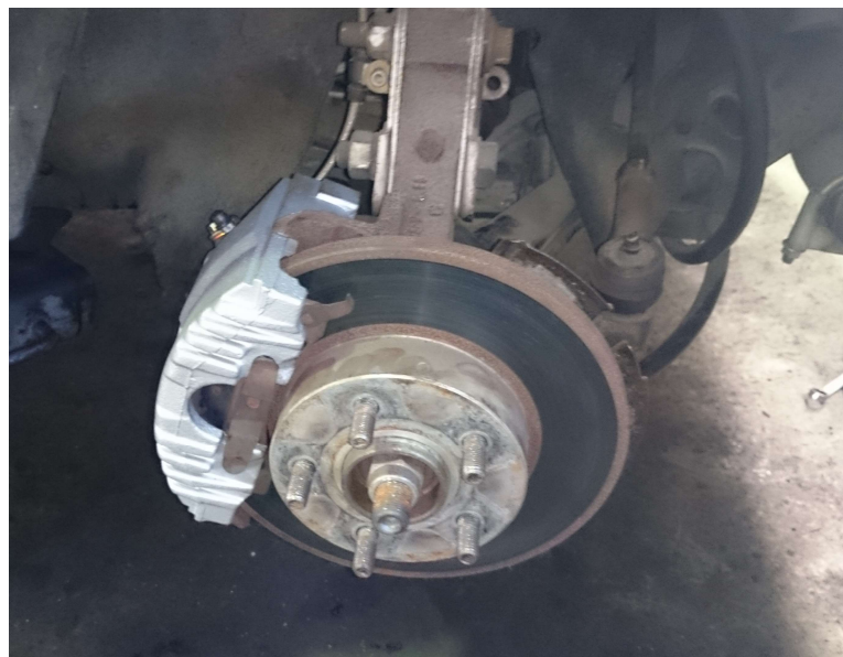
交換後の左側キャリパー