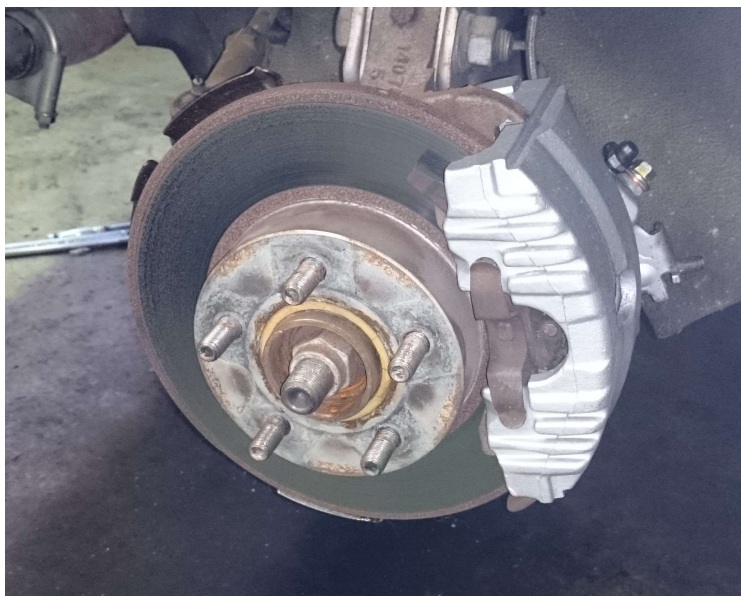
交換後の右側キャリパー