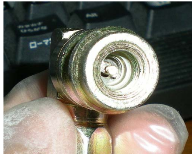
R132Aサプライ側ーバルブコア(ムシ)有り