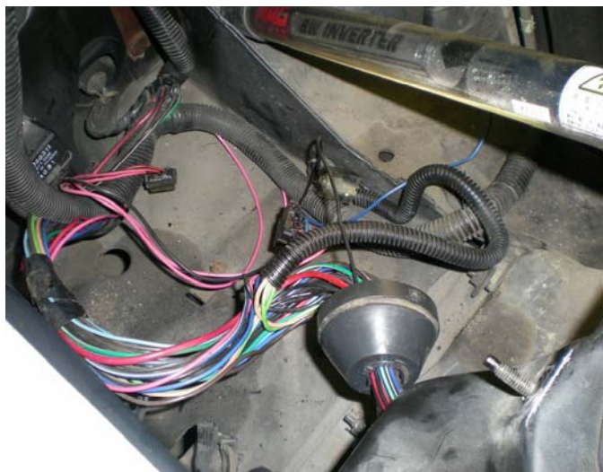
運転席側ヘッドランプバケット下の配線改造中です。

モーターへの電源の供給はこれまでの3線から2線となります。コネクタの形状が変更となりますので、87-88年式ワイヤーハーネスが必要となります。