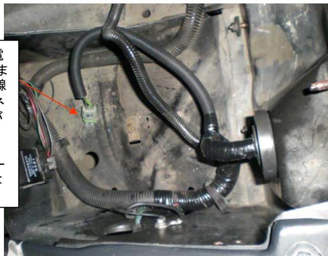
運転席側の配線が完了して配線をルーム内に戻した状態です

モーターへの電源の供給はこれまでの3線から2線となります。コネクタの形状が変更となりますので、87-88年式ワイヤーハーネスが必要となります。